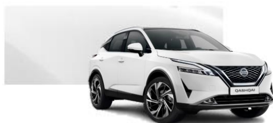
326 Bílá (8000 Kč)