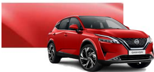
Z10 Červená (bez příplatku)