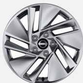
17" kola z lehké slitiny