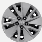
17" ocelové disky