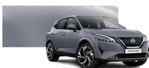
KBY Šedá Ceramic