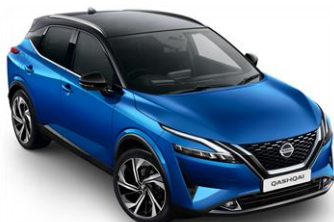
XFV Modrá Vivid – Černá