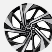
20" kola z lehké slitiny