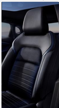
B - Černé látkové čalounění s tmavě modrými vložkami ze syntetické kůže