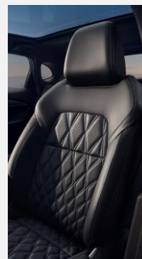
B - Čalounění sedadel kůží Nappa 5