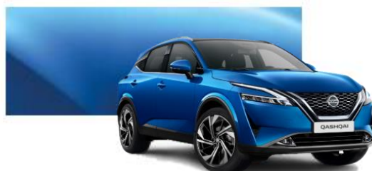
RCF Modrá Vivid