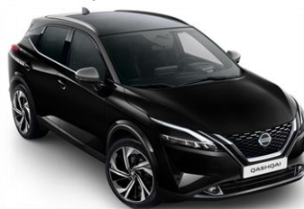
XDK Černá - Šedá