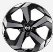
18" kola z lehké slitiny