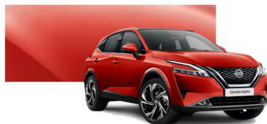
NBV Červená Sunset