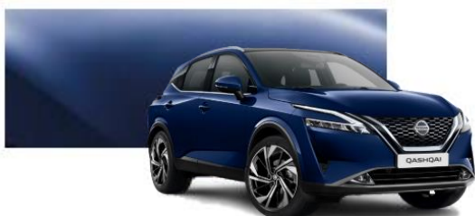
RBN Modrá Indigo