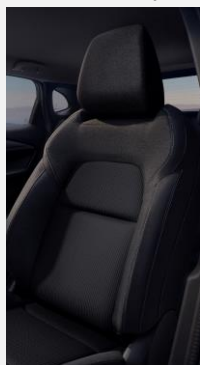
G - Černé látkové čalounění