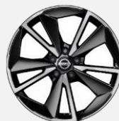
19" kola z lehké slitiny