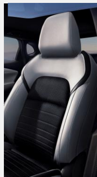
K - Černé látkové čalounění se světle šedými vložkami ze syntetické kůže