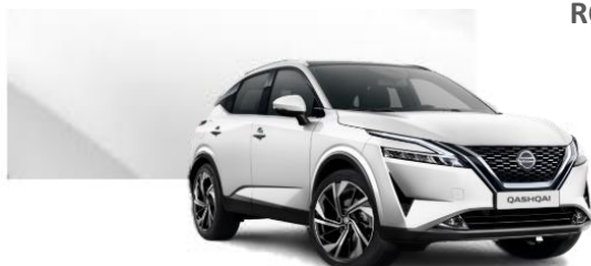
QAB Bílá Pearl