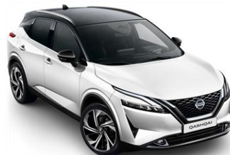
XDF Bílá Pearl - Černá