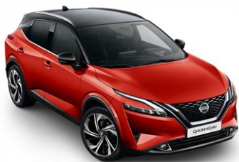
XEY Červená Sunset - Černá